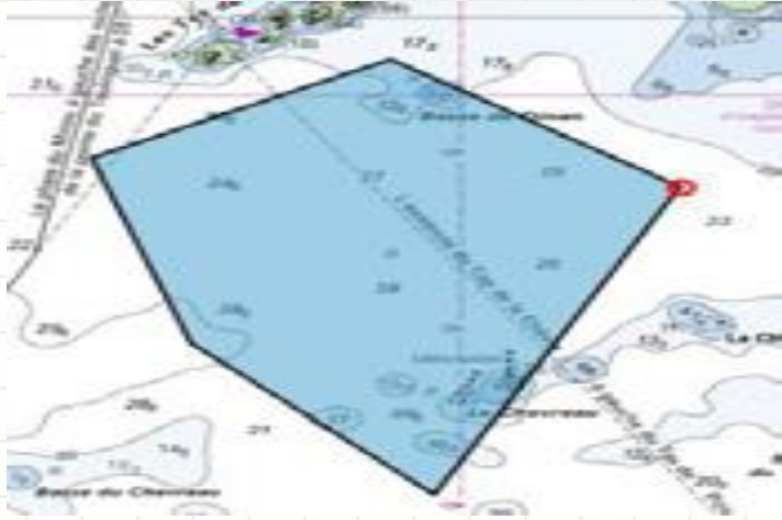
Insérer un polygone