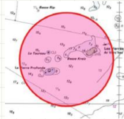
Insérer un cercle