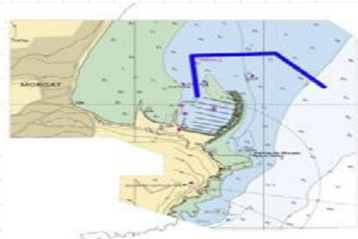
Insérer une ligne